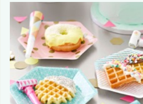
Il tavolo del buffet deve essere colorato ed invitante.