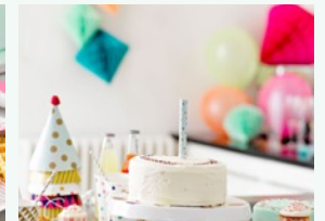
Decoratelo con attenzione ed amore.