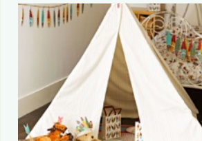
Fate scegliere ai vostri figli il tema della festa.