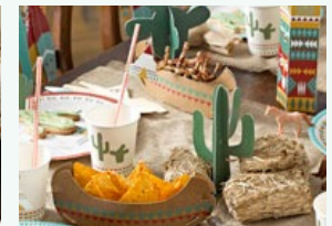
Proponete loro due o tre temi tra cui scegliere.