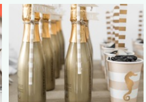
Versatele in bottigliette e recipienti che decorerete.